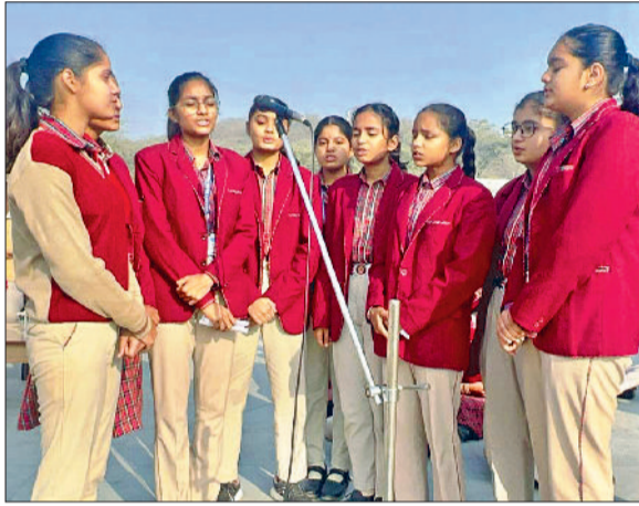
नारनौल। कार्यक्रम में गीत प्रस्तुत करती छात्राएं।