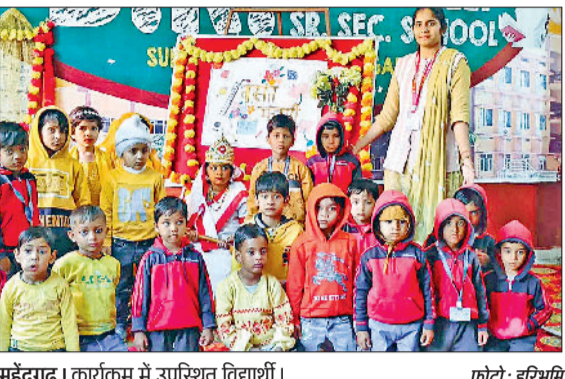
महेन्द्रगढ़। कार्यक्रम में उपस्थित विद्यार्थी।