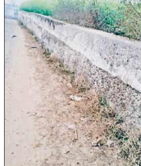
कनीना। गुढ़ा केमला स्थित आरयूबी 89 की जर्जर दीवार।

बरसाती पानी से मिट्टी व झाड़बोझ को मिल रहा बढ़ावा हरिभूमि न्यूज़ | कनीना