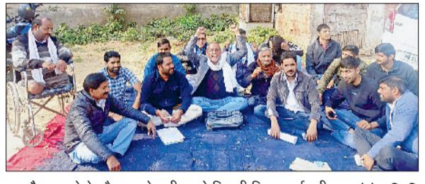
नारनौल। धरने के दौरान नारेबाजी करते बिजली निगम कर्मचारी।

■ संगठन ने की हरियाणा बिजली निगमों में आदर्श ऑनलाइन ट्रांसफर पॉलिसी लागू नहीं करने की मांग